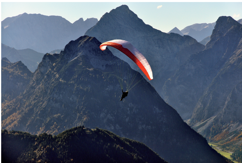
Wer wie hier in den Bergen Wert auf kleines Gepäck legt, ist mit dem kompakten NIKKOR-Telezoom gut beraten