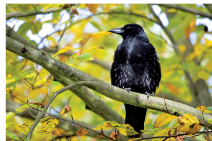
In maximaler Telestellung von 300 mm, die im Kleinbild immerhin 450 mm entspricht, bekommt man auch scheue Motive aufs Bild